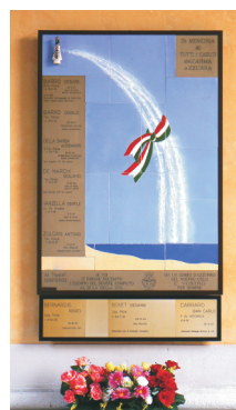
Pannello artistico ubicato all'entrata del cimitero