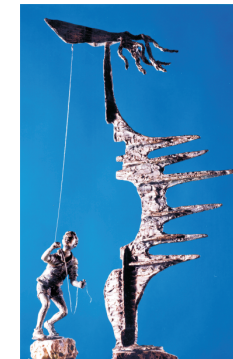
Monumento ai caduti dell'aria, opera del 2001 dello scultore Carlo Balljana