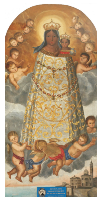
Pala della Madonna di Loreto opera del 1600 restaurata nel 1992 ubicata nella cappella della chiesa di S. Martino