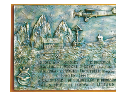
Targa ricordo piloti Locatelli e Finato ubicata al Rifugio Locatelli nel 2006, realizzata dallo scultore Balljana