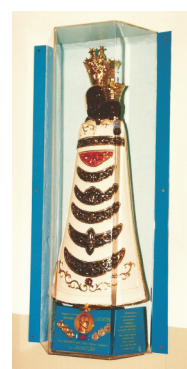
Simulacro della Madonna di Loreto ubicato al rifugio Locatelli alle Tre Cime di Lavaredo